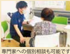
専門家への個別相談も可能です

難聴は認知症のリスクを高めるため、早めに発見し、対策をとることが重要です。オレンジプランのような認知症対策の中で、難聴への対応も強化されています。年を重ねる中で、医療関係者やご家族、そして社会全体が協力して、認知症の予防と治療に取り組むことが大切です。