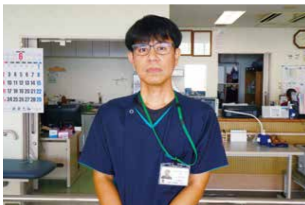
介護老人保健施設 はまゆう リハビリテーション科科長