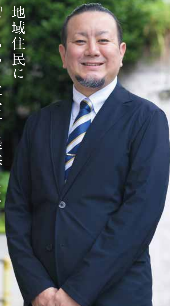
ぎのわんおもと園 通所リハビリテーション科科長