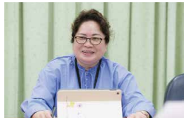
沖縄看護専門学校 教務主任

平成8年に沖縄リハビリテーション福祉学院(作業療法学科1期生)を卒業し、大浜第一病院入職後おもととよみの杜開設時に第二病院へ異動。その後、宜野湾記念病院、ぎのわんおもと園と勤めました。初の科長職なので、ご指導よろしくお願いたします。