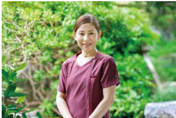
デイケアセンターあめくの杜 科長