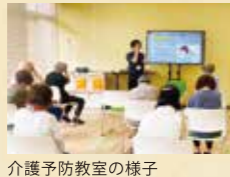
介護予防教室の様子