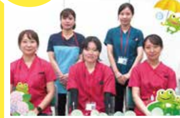
今月の新入職員 何事にも全力で取り組みます!!

『七夕』 7月7日は七夕です。なぜ短冊に願い事を書くのでしょうか？ 昔の人が、織物の上手な織姫のように（織姫にあやかって）、「物事が上達しますように」と、「お願い事をしたのが始まりだと言われています。笹の葉に飾ると、織姫と彦