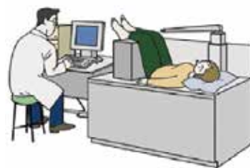
骨密度測定法 (DXA法による腰椎骨密度測定)

175700例（男性37600例、女性138100例）で、将来の人口推計に基づく、その発生数はだんだんと増加し、2040年には32万人に達すると予測されています。決して他人事ではなく、まずは予防をしっかり行うことが重要になってきます。大腿骨頸部／転子部骨折診療ガイドラインによると、太ももの付け根の骨折の予防としては、薬物による骨粗しょう症の治療と、『在宅』高齢者における運動療法、住環境の調整が推奨、効果のある治療とされています。現在、当院を含め骨密度の検査や治療は多くの医療機関で受けることができます。50歳60歳を超えて一度も検査を受けたことのない方は、ぜひかかりつけ医に相談してみることをお勧めします。また一度骨折してしまい手術やギプスでの固定で治った方も骨折の連鎖を起こさないようにしっかり評価、治療を継続し健康的に元気で過ごせるよう頑張ってください。