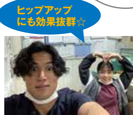
ヒップアップにも効果抜群☆