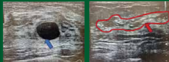
良性(のう胞) 悪性(非浸潤性乳管がん)

当センターでは、乳腺エコーを受ける事が出来ます。超音波を乳房の表面からあて、内部の様子を観察する検査で、検査時間は10~15分程度です。腫瘍の有無やその腫瘍が良性か悪性かある程度判別することが可能です。乳がんは9人に1人がなる時代です。 予防や早期発見のためにも健診にて乳腺エコー検査もお勧めします。