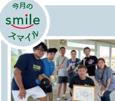
今月の smile スマイル テニス大好きメンバー ※日々の練習の成果が実り、優勝することが出来ました!!

医療法人おもと会 大浜第一病院 総合健康管理センター (人間ドック室) お問合せ：098-866-5182(直通) お問合せ時間：月~金/8:30~16:30 土/9:00~12:00