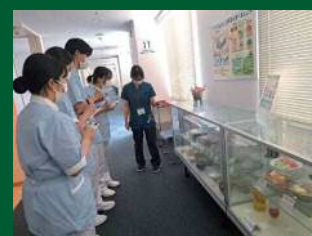
おもと会看護学校の学生の皆さん

健康センターではコロナ感染対策のため、看護学生の見学実習を3年間中止していましたが、5月から再開しました。健診施設の役割や健康期における生活習慣と健康課題を知り、健康支援の場を見学し学ぶことを目的としていきます。これからは各学校から来ますのでその際は、ドック受診者の皆様へご協力の程、宜しくお願い致します。