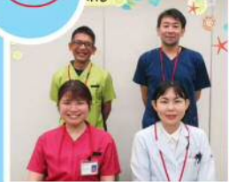
今月の新入職員 ご期待に応えるべく努めてまいります