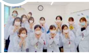
ドクターサポート課 診療を率先してサポート致します。

医療コンシェルジュ・上地の 外来より こんにちは 『共感した言葉』 性格は、顔に出る 生活は、体型に出る 本音は、仕草に出る 感情は、声に出る センスは、服に出る 清潔感は、髪に出る 落ちつきのなさは、足に出る 本当にその通りだと思った言葉でした。