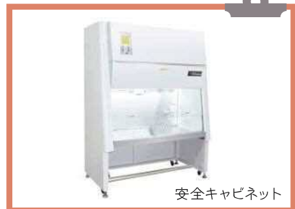
安全キャビネット

新型コロナウイルスのPCR検査を分析しているスタッフが臨床検査技師です。臨床検査技師は、感染防止のため「使い捨て手袋・マスク・フェイスガード」を着用します。更に安全キャビネット(医療機器)を使用しているため、空気の壁でウイルスが外に漏れず、職員の管理によって陽性と陰性の混在を防いでおり、ウイルスを周囲に撒き散らさないよう対策を行っております。(次回に続く)