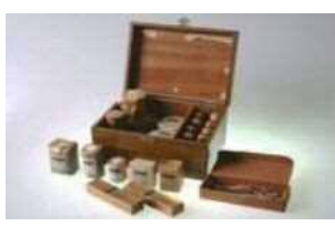
大正時代の救急箱: 健胃錠・稀コード丁幾(チンキ)等の薬品と包帯・ガーゼ類。

最近、CMを見ていて、実家に救急箱があったの思い出し、懐かしい気持ちになりました。今では、怪我や防災用だけでなく、様々な薬を保管している家庭も多いのではないのでしょうか。「救急箱」の「救急」の語源は、「急難を救うこと」とあります。「いざ」という時にいつでも使えるように、「使用期限」を確認してはいかがでしょうか。また、いつもの「古い薬」を整理することも大切です。何かわからない事があれば、薬剤師に相談して下さい。