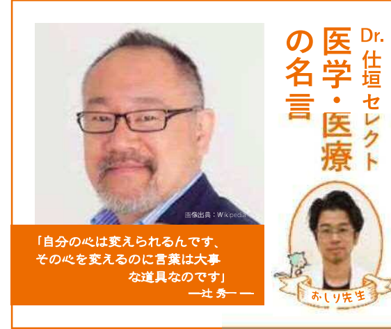
Dr. 仕垣セレクトの医学・医療の名言

「自分の心は変えられるんです、その心を変えるのに言葉は大事な道具なのです」 — 社秀 —